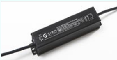
L x B x H / 196 x 40,2 x 34 mm indoor / outdoor IP 67 output voltage 24 VDC input voltage 90 - 264 60 Watt