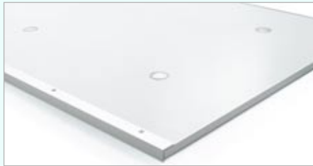
Rückseitige Ansicht Rahmen und Magnethalterungen