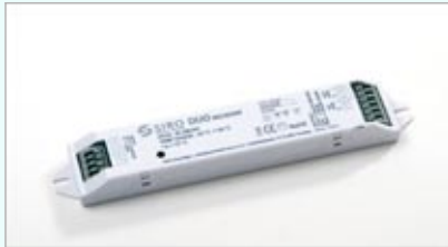
L x B x H / 150 x 30 x 20 mm 868 MHz Radio Frequency Sender pro Receiver bis zu 8 Controller anlernbar dadurch einfache Gruppierung von Leuchten 24 VDC / 2x 72 W ( 144 W )