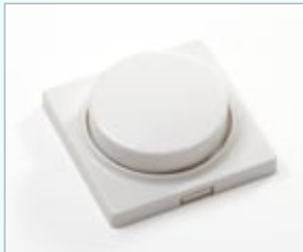
Funk Controller - Dimmer, Fernbedienung und Farbtemperaturregler L x B x H / 50 x 50 x 20mm 868 MHz Radio-Frequenz Sender bis zu 100 Receiver - in Reichweite steuerbar Reichweite ca . 30 - 40 m funktioniert auch durch Wände