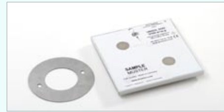
Magnethalterungen mit Haftblechen zur Wandbefestigung